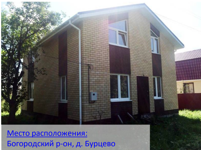
Место расположения: Богородский р-он, д. Бурцево